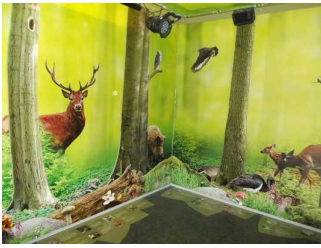
Blick in den Ausstellungsraum