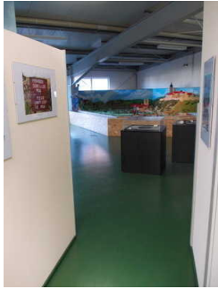
Bewegungsfläche vor der Tür