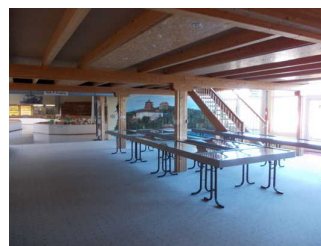
Blick in den Raum