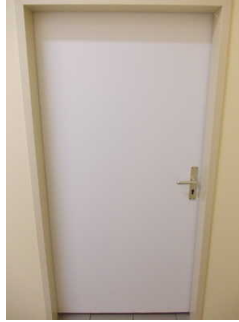
Tür zur Toilette

Die Toilette gehört zu: Kleiner Saal , Bereich "Thüringen" , Bereich "Harz" , Bereich "Europa" , Bereich "China" , Bereich "USA" , Ausstellung zur Geschichte des Geldes , Bereich "Osterinsel"