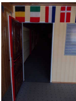
Tür zur Terrakotta-Armee