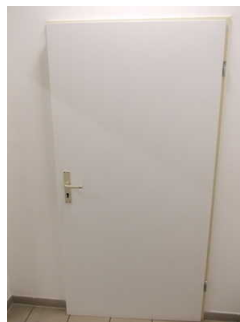
Tür zur Toilette

Die Toilette gehört zu: Kleiner Saal , Bereich "Thüringen" , Bereich "Harz" , Bereich "Europa" , Bereich "China" , Bereich "USA" , Kunstgalerie , Ausstellung zur Geschichte des Geldes , Bereich "Osterinsel"