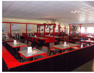
Blick ins Restaurant