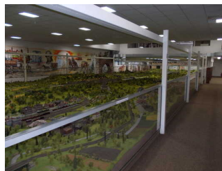
Modellbahnen Bereich "Thüringen"