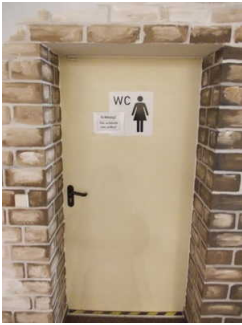
Tür zu den Damentoiletten