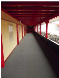
Gang mit Blick auf die Terrakotta-Armee