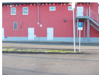
Behindertenparkplatz in der Nähe des Eingangs