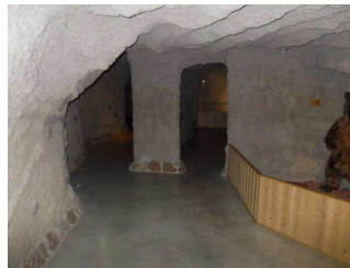
Schmalster Durchgang = 70 cm