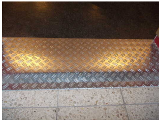
Schräge an der Tür