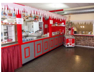
Theke im Restaurant

Der Zugang zur Rezeption / Kasse ist stufen- und schwellenlos.