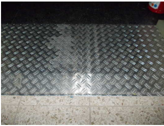
Schräge am Eingang

Zugang zum Raum über: Treppe zum Restaurant (vom Eingangsbereich) , Aufzug zum Restaurant