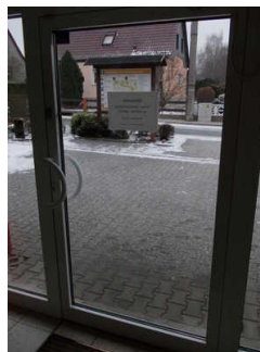
Eingangstür von innen

Zugang zum Betrieb / zur Einrichtung über eine Stufe / Schwelle.