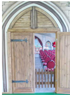
Tür zum Kleinen Saal