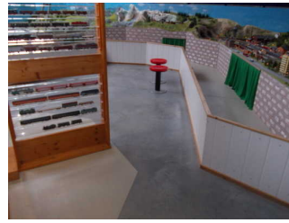
Engstelle = 100 cm