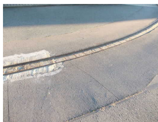
Schienen und Schräge auf dem Weg zum Eingang