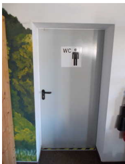
Tür zu den Herrentoiletten