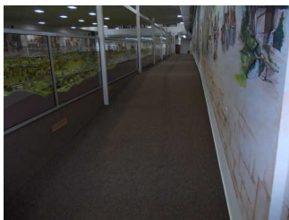
Schräge rechts neben der Modellbahnplatte