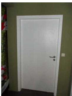
Tür zur Toilette