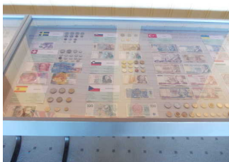
Unterfahrbare Glastische mit Exponaten