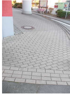
Schräge auf dem Weg zum Eingangsbereich

Über den Weg sind zu erreichen: Eingangsbereich