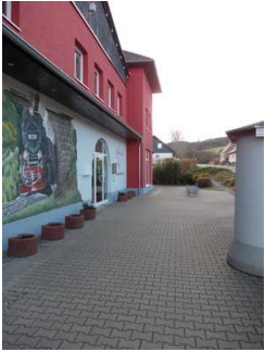
Weg zum Eingangsbereich