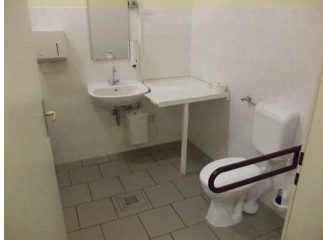
Behindertentoilette für Damen