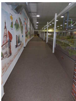
Schräge links neben der Modellbahnplatte