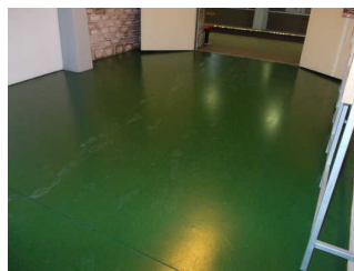
Schräge am Übergang zum Bereich "Europa"