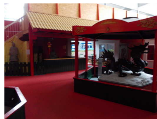
Allgemeiner Bereich "China"