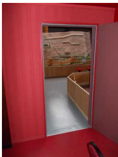
Tür zur Terrakotta-Armee

Tür gehört zu: Bereich "China" , Bereich "USA"