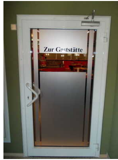
Tür zum Restaurant